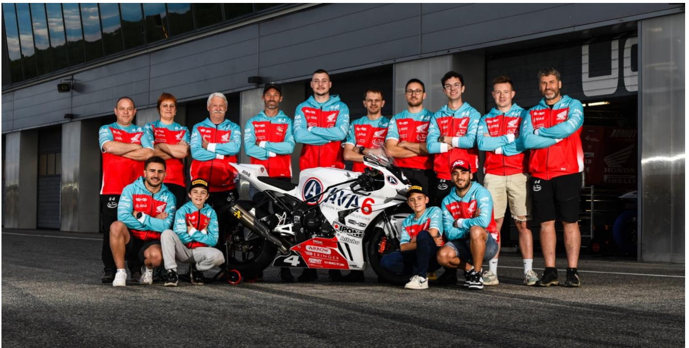
AVA6 partenaire en Endurance (EWC), mais aussi sur la Tati Team Academy et le Championnat de France Superbike (FSBK)

Depuis sa 1 ère saison en Endurance en 2014, la progression du TATI TEAM a été remarquable. Le team a d'abord décroché le titre en catégorie Superstock en 2018, avant de monter sur 2 podiums en EWC (2 ème à Spa en 2022, puis 3 ème à Spa en 2024). Le team a également frôlé l'exploit à plusieurs reprises : en 2022, lors de la finale du championnat sur le circuit du Castellet, à la mi-course, le TATI TEAM était virtuellement Champion du Monde EWC... avant une casse moteur. Puis, en septembre 2024, au Bol d'Or, le team a mené la course pendant la 1 ère heure, devançant tous les teams officiels et leurs pneus de développement. Cette décennie de moments clés témoignent de l'évolution positive du team. De "petit" team privé français en Superstock, le TATI TEAM est aujourd'hui reconnu comme un véritable challenger de la catégorie reine de l'EWC. Cette transformation a été rendue possible grâce à des moyens humains, techniques et financiers, même si l'équipe reste encore bien loin des ressources financières des teams d'usine.